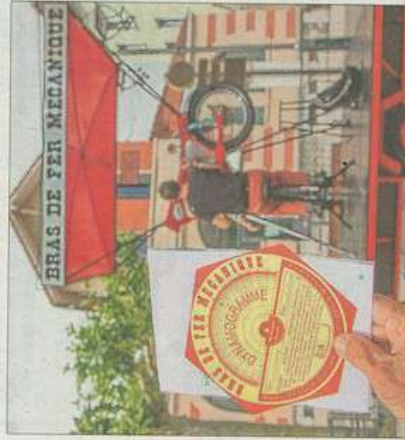
Une estrade pour Le bras de fer mécanique, une caravane sonore pour le Déplacement International du Muerto Coco, autant de lieux plus intimes, voire intimistes, qui proposent un rapport différent aux spectateurs. C'est aussi ça la magie des arts de la rue.